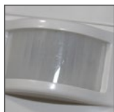
do użytku wew. pomieszczeń