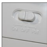
SES02, SES03: funkcje ON, OFF, PIR