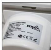
do użytku wew. pomieszczeń