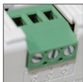
podłączenie 3-przewodowe (L, N, L 2 )

MOTION SENSOR BEWEGUNGSMELDER ДАТЧИКИ ДВИЖЕНИЯ РОУНУВОВÉ ČIDLO